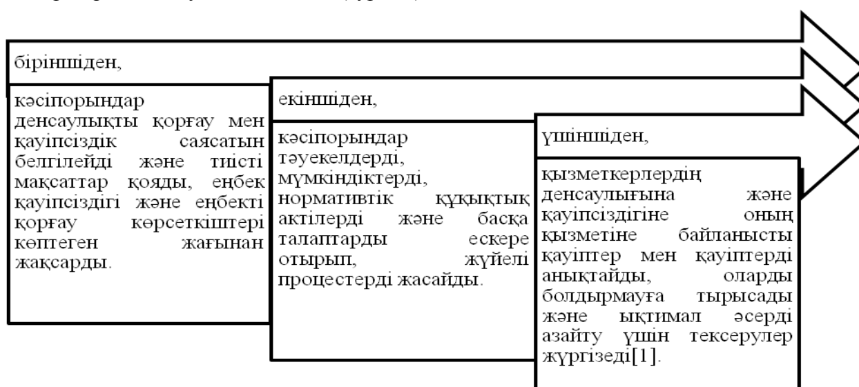
Сурет 1 Кәсіпорын ТОО "Кварц kz" денсаулық сақтау және еңбекті қорғаудың халықаралық стандарттарын енгізудің тиімділігі

Кәсіпорын ТОО "Кварц kz" денсаулық сақтау және еңбекті қорғаудың халықаралық стандарттарын енгізудің тиімділігі (сурет 1):