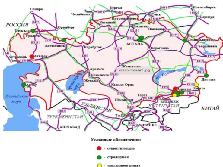
Рисунок 1 – Международные транспортные коридоры Казахстана

Ведутся реконструкции трасс «Алматы – Талдыкорган – Усть-Каменогорск – Шемонаиха – граница РФ» (768 км), «Актобе – Атырау – граница РФ» (746 км), «Майкапшагай – Калбатау – Семей – Павлодар – граница РФ» (415 км) и «Алматы – Астана – Петропавловск – граница РФ» (31 км). [1]