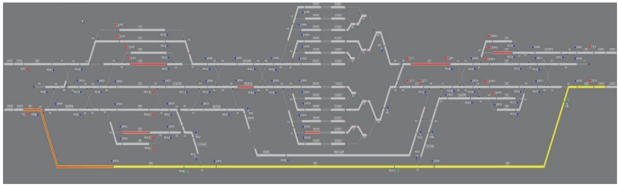
Сурет 1. Сұрыптау станциясын басқару тренажер кешенінің интерфейсі

Пойыздардың қозғалысын басқару саласында теміржол қызметкерлерін даярлау сапасын арттыру өзекті міндет болып табылады, сондықтан жаңа бағдарламалық құралдар мен оқу симулятор әзірлеу қажет. Сұрыптау станциясын басқарудың виртуалды стимулятор кешенін енгізу "темір жолдар" мамандығы бойынша оқитын студенттердің ғана емес, сондай-ақ біліктілікті арттыратын поездар қозғалысын басқару дирекциясы қызметкерлерінің де кәсіби технологиялық сауаттылық деңгейін арттыруға мүмкіндік береді.