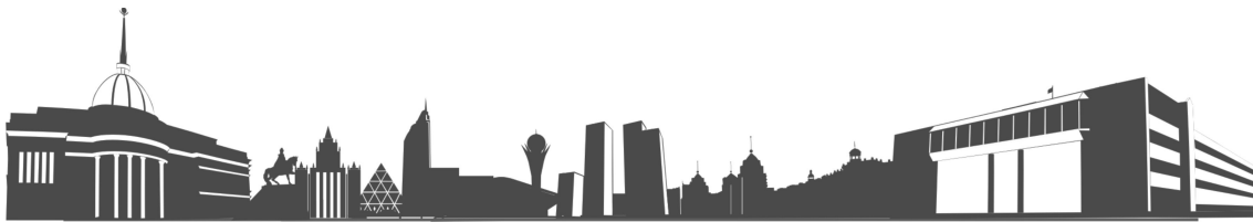
Рисунок 6 – Название рисунка