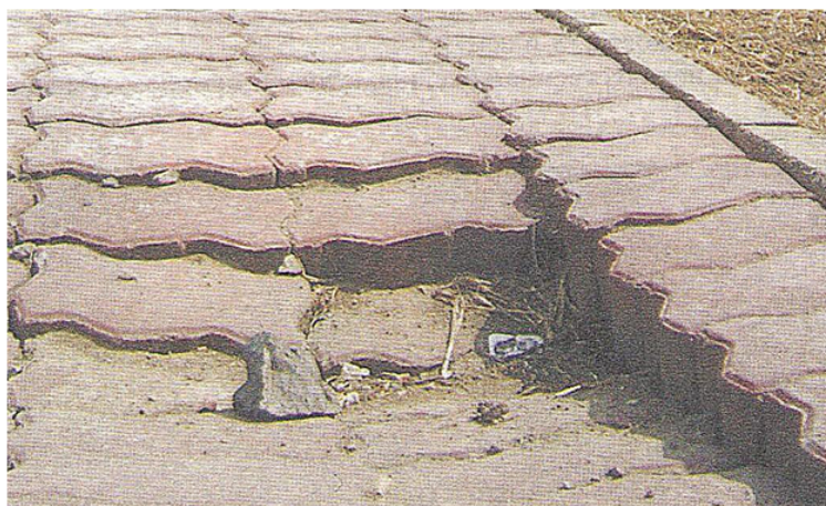
FIGURE 2 – After the first cloudburst, the section of the ground base from the sinking loam sagged, followed by sand preparation and paving stones.

each layer to be laid should correspond to the operating parameters of the soil compacting machine and the type of soil. If the main technological requirements are not fulfilled, defects of the pavement carpet of the sidewalk or city area arise due to deformation of the poorly prepared ground base (uneven sediment in areas with different ground densities, or presence of inclusions of subsidence or fluffiness).