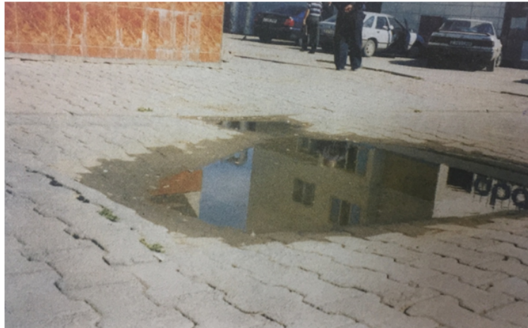
FIGURE 1 – The site of the sidewalk along the Republic avenue. In the absence of a slope towards the drainage of rainwater, sediment of a poorly prepared soil base and, as a consequence, sediment of paving stones.

Let us examine in detail each of the above violations of rules, norms and technological discipline.