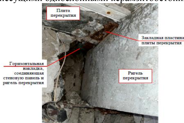
Рис. 4. Горизонтальные накладки в уровне верха ригеля

Анализ состояния стеновых панелей в течение длительного времени эксплуатации, выполненных на объектах по аналогичной серии 1-335А приведен в работе Касимова Р. Г. [1], на примере жилого крупнопанельного 9-этажного дома с несущими однослойными керамзитобетонными стенами.