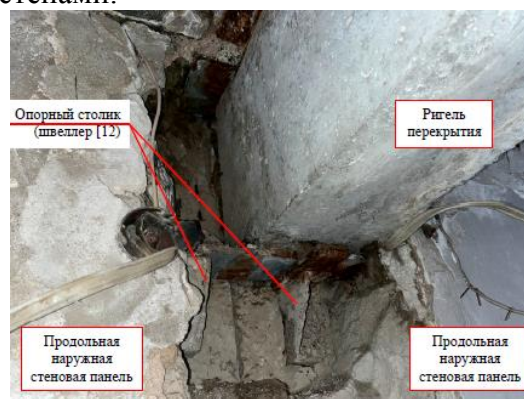
Рис. 5. Опираение ригеля перекрытия

Определено, что для стеновых панелей характерны магистральные трещины с переменной шириной раскрытия по высоте в пределах от 0,3 до 3,5 мм, с глубиной более 60 мм, трещины в горизонтальных и вертикальных швах, наличие раковин.