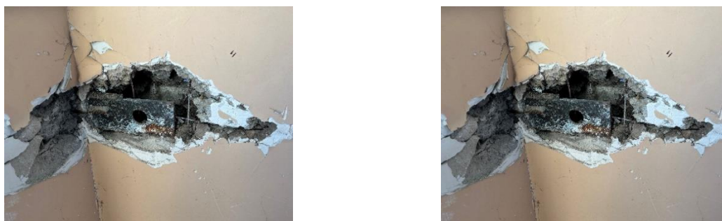
Рис. 9. Оголение закладной детали со следами коррозии в стыке стеновой панели

Для определения категории технического состояния и оценки стеновых панелей с учетом выявленных дефектов и повреждений выполнен расчет физического износа конструкции. Принят нормативный срок железобетона 125 лет, фактический срок эксплуатации конструкции обследуемого объекта 59 лет. Коэффициент для бетонных слоев K_1=0,45 . Основание - СП РК 1.04–102–2012.