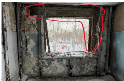
Рис. 7. Стеновая панель с разрушением газобетонного слоя: а – в осях 5–6/А на отм. +0,000 (1 этаж); б- в осях 16–17/А на отм. +10,800 (5 этаж); в – в осях 6–7/В на отм. +8,100 (4 этаж)