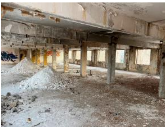
Рис. 3. Основные несущие конструкции здания

Объемно-планировочное решение представлено в виде свободной планировки с полным отсутствием перегородок (Рис.3).