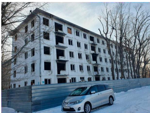
Рис. 1. Старый корпус студенческого общежития ЕНУ им. Л.Н. Гумилева

Здание двухпролетное с подвальным помещением, с размерами в плане 11,6×45,4м., 5-этажное, двухподъездное, крупнопанельное, с повторяющимися поэтажными планами в осях 1-18; А-В (Рис.2.). Высота этажа 2,6 м. На момент обследования здание не эксплуатируемое.