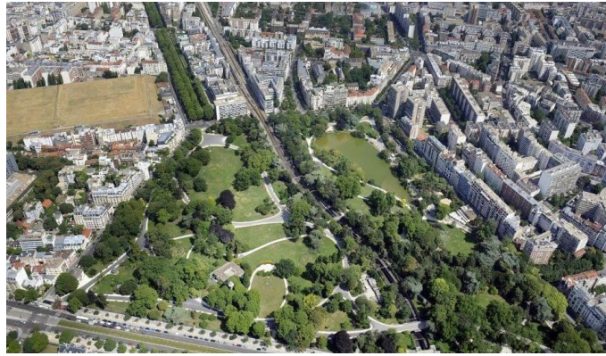
Рисунок 4. Парк «Монсури»