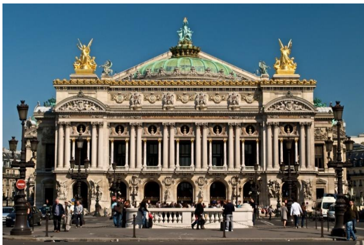
Рисунок 2. Опера Гарнье. Один из ярких примеров облагораживания Парижа бароном Османом. Архитектор – Шарль Гарнье

2. Точечная перенаселенность. Концентрация людей в центре города приводила к естественному выдавливанию менее состоятельных жителей к периферии, что вызывало сильное расслоение и преступность, а также увеличивало шансы распространения болезней. Решением было создание более широкого профиля улиц и модернизация жилых помещений. Неуместные малоэтажные здания сносились, а на их месте планировалось построить более комфортные сооружения и дома средней этажности. Что также способствовало формированию более комфортных пешеходных связей и проездов к культурно-зрелищным сооружениям.