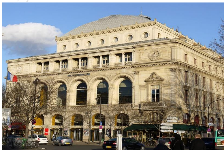
Рисунок 1. Театр де ла Вилль. Архитектором выступил Габриель Давид, по личному заказу барона Османа.

1. Устаревание инфраструктуры. Высокие здания, узкие извилистые улочки – ширина их во французской столице когда-то составляла от одного до пяти метров. Барон Осман уделял высокий приоритет расширению улиц и бульваров, для свободного передвижения транспорта и людей. Как уже упоминалось, подобная структура улиц не позволяла развиваться архитектуре культурно-зрелищных сооружений. Зачастую каркас города формировался за счет уникальных исторических сооружений, которые располагались на пересечении главных улиц и в структуре городских площадей. С этой целью были спроектированы и реализованы несколько культурно-зрелищных сооружений по просьбе барона Османа. (Рис. 1, 2)