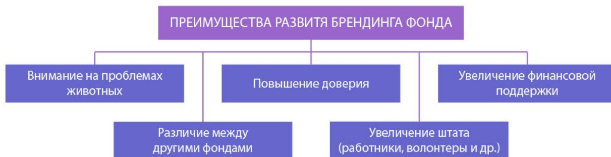
Рис. 3 Преимущества развития брендинга фонда

Более того на сегодняшний день большинство людей озабочены проблемой братьев меньших и готовы поддержать их безопасность. На рисунке 3 показана классификация преимуществ развития брендинга фондов.