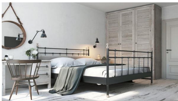
Сур.1 Заманауи скандинавиялық стильдегі жатын бөлме

сияқты көрінуі мүмкін. Олай емес. Скандинавиялық стиль басқа бағыттармен бірігіп, жайлы және үйлесімді кеңістік жасай отырып, сән метаморфозына оңай бейімделеді [2].