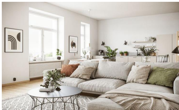
Сур.2 Қазіргі скандинавиялық стильдегі қонақ бөлме

Дизайнерлер үшін басты Шабыт, әрине, табиғат — табиғи ландшафттардың түстерінің керемет үйлесімі, қаттылық пен икемділікті, табиғи материалдарды және пейзаждардың шексіз сұлулығын біріктіретін жеңіл ағаш. Бұл бүкіл дүниетанымдық жүйе, ол очаровательно және шабыттандырады, үйде эргономикалық жайлылық жасайды, барлық қажетті тұрмыстық құралдармен ұзақ қысты барынша жайлылықпен өткізуге болады.