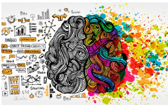
Сур. 2 Графикалық дизайнның негізгі бағыттары

Жалпы, графикалық дизайн визуалды коммуникацияда маңызды рөл атқарады және оны қолдану бизнес пен маркетингте табысқа жетудің негізгі факторы болып табылады. Графикалық дизайнды дамытуға және жақсартуға деген ұмтылыс қазіргі көрнекі ақпарат әлемінде бәсекеге қабілетті және тиімді болып қалу үшін маңызды [4].