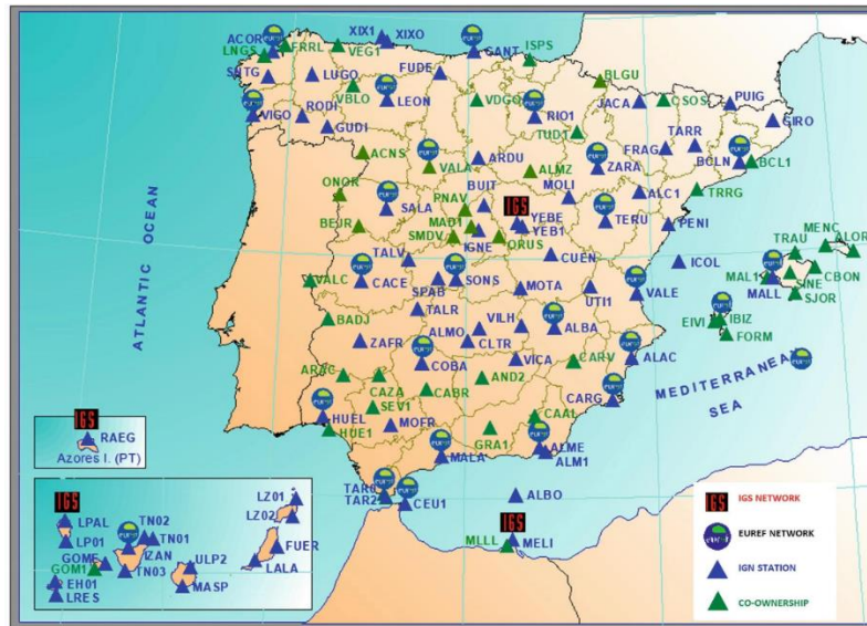
Рис.4 Испанская национальная постоянная сеть ГНСС (ERGNSS). Синие треугольники - станции IGN; зеленые треугольники - станции, находящиеся в совместном владении.

Главную основу в системе геодезического обеспечения территории Российской Федерации используется фундаментальная астрономо–геодезическая сеть (ФАГС). Предназначена для перспективы развития, повышения качества нахождения пунктов государственной сети. ФАГС по существу создает геоцентрическую систему координат в пределах определения задач координатного и временного обеспечения (КВО).