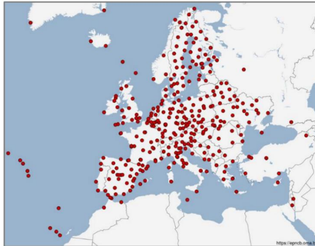
Рис.1 Схема расположения станций сети EUREF

Создание геодезических сетей в Германии осуществляется при помощи специальных организаций, таких как Федеральное агентство по кадастру и геодезии (BKG) и Геодезический институт Фридриха Шиллера (IfAG) [3]. Эти организации занимаются разработкой и поддержкой геодезических сетей в Германии, а также обеспечивают доступ к данным о геодезических сетях для широкой общественности. Геодезические органы земель Федеративной Республики Германия (AdV) работают со спутниковой службой позиционирования SAPOS в рамках совместного проекта и таким образом обеспечивают актуальную, официальную пространственную привязку широкой территории для всех, используя современные технологии. Система основана на сети из примерно 270 референчных станций ГНСС, которые обслуживаются компанией AdV. Основой услуги SAPOS является сеть из примерно 270 опорных станций GNSS, постоянно работающих в федеральных землях, а также других опорных станций в соседних землях Федеративной Республики. Сеть состоит из более чем 250 станций с расстоянием между станциями от 30 до 50 км. Это гарантирует предоставление высокоточных и единообразных услуг данных по коррекции для всего штата в официальной трехмерной системе отсчета (ETRS89/DREF91).