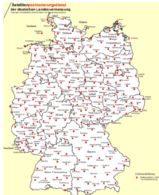
Рис.2 Станции немецкой сети активных референчных станций SAPOS

Создание геодезических сетей в Германии осуществляется при помощи специальных организаций, таких как Федеральное агентство по кадастру и геодезии (BKG) и Геодезический институт Фридриха Шиллера (IfAG) [3]. Эти организации занимаются разработкой и поддержкой геодезических сетей в Германии, а также обеспечивают доступ к данным о геодезических сетях для широкой общественности. Геодезические органы земель Федеративной Республики Германия (AdV) работают со спутниковой службой позиционирования SAPOS в рамках совместного проекта и таким образом обеспечивают актуальную, официальную пространственную привязку широкой территории для всех, используя современные технологии. Система основана на сети из примерно 270 референчных станций ГНСС, которые обслуживаются компанией AdV. Основой услуги SAPOS является сеть из примерно 270 опорных станций GNSS, постоянно работающих в федеральных землях, а также других опорных станций в соседних землях Федеративной Республики. Сеть состоит из более чем 250 станций с расстоянием между станциями от 30 до 50 км. Это гарантирует предоставление высокоточных и единообразных услуг данных по коррекции для всего штата в официальной трехмерной системе отсчета (ETRS89/DREF91).