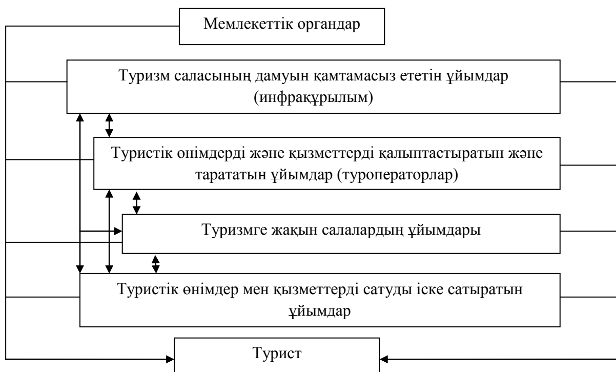
Сурет 1. Туризм саласының институционалды құрылымы

Институционалды жүйе арнаулы институттық ортада қалыптасады және жүйе элементтерінің дұрыс таңдалуына кепілдеме бере алмайды, осыдан тиімді және тиімді емес институттардың табиғи пайда болуын күтуге болады және олар қалыптасқан ортаға бейімделеді.