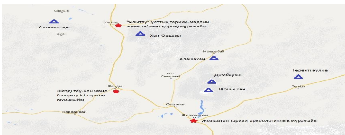
Сурет 2. «Ұлытауға саяхат» маршрутының картасы

Жастар – ел болашағы. Ұлытауды зерттеу – жастардың болашағы. Біз, жастарды ел сүйгіш азамат болып өсуі үшін, өзінің туып өскен жерінің әр тасы