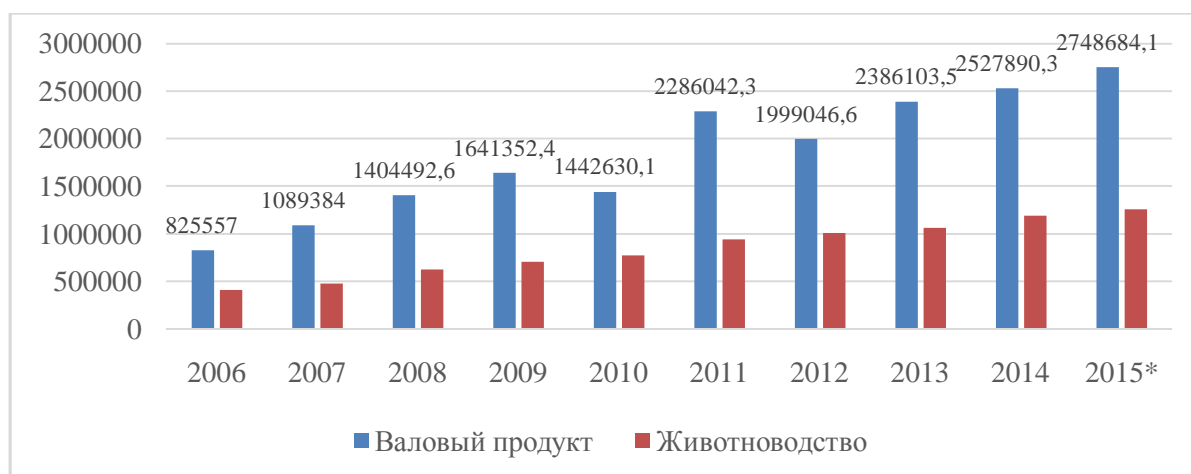
Рисунок 1 – Валовой выпуск продукции сельского хозяйства за 2006-2015гг., млн.тг [2]

Как видно из рисунка 1, за последние десять лет объем валовой продукции сельского хозяйства увеличился на 1702,3 млрд тг в совокупном объеме. По оперативным данным Комитета по статистике МНЭ РК валовой выпуск продукции в 2015 году составил 2748,68 млрд.тг, что больше на 220,794 млрд. тг, чем в 2014 году. Доля по отрасли животноводства составила 47% по итогам 2014 года. На конец 2014 года объем валовой продукции в секторе животноводства составил 1189,5 млрд. тенге. В целом, начиная с 1990 года, наблюдается положительная динамика развития отрасли и в данный момент, отрасль животноводства держит высокую позицию. Это указывает на то, что именно животноводство стимулирует положительный рост экономической среды Казахстана, и обосновывает эффективность производства.