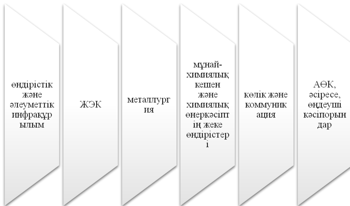
Сурет 1 - Экономикалық жалпылама салалық басымдықтар

Ескерту - мәліметтер негізінде автормен құрастырылған [2]