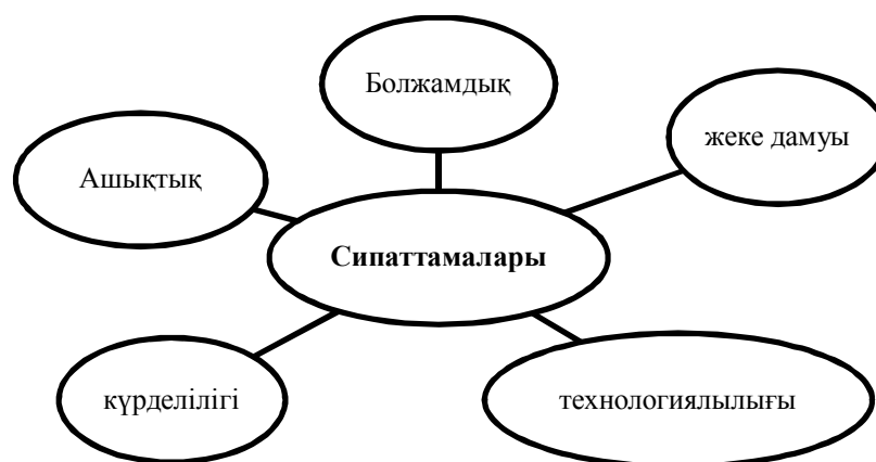
Сурет 2. Қазіргі заманғы бухгалтерлік есеп жүйесінің сапалық сипаттамалары

1-кестеде келтірілген әлеуметтік-экономикалық факторлармен қатар жаһандық жағдайда бухгалтерлік есеп жүйесін модельдеудің дамуына әсерін тигізетін алғышарттың бірі бухгалтерлік есептің сапалық сипаты болып табылады (2-сурет).