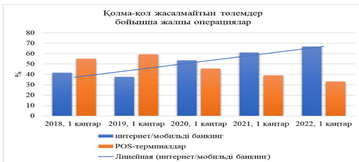
Сурет 2 – Қолма-қол жасалмайтын төлемдер динамикасы, соңғы бесжылдық Ескерту: [4] дереккөз негізінде автормен құрастырылған.

2021 жылы Шымкент, Нұр-сұлтан және Алматы қалаларында қолма-қол ақшасыз операциялардың үлесі операциялар сомасы бойынша 77% - дан 87% - ға дейін диапазонда болды. Ал Қазақстанның 14 облысында бұл көрсеткіш 69% деңгейінде.