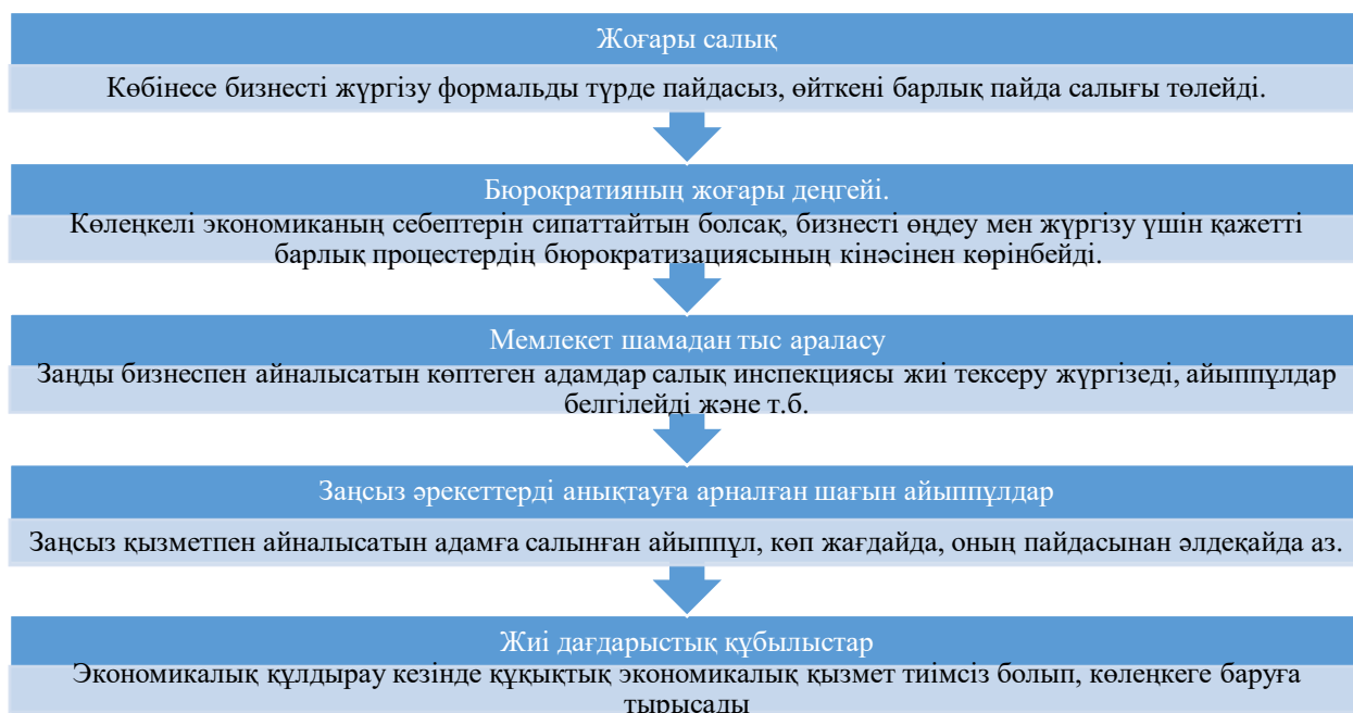
Сурет 3. Заңсыз әрекеттердің пайда болуын тудыратын негізгі факторлары

Көлеңкелі экономиканың пайда болуының себептеріне экономика дамуының және халықтың әл-ауқатының төмен деңгейі, кірісті мемлекет пен қалған экономика арасында регламенттейтін заңнаманың жетілмеуі, бизнесті ашу және жүргізу рәсімдерінің реттелуі, жасырын экономиканы бағалау әдістерінің және осы проблема бойынша мемлекеттік органдар арасындағы ақпарат алмасудың жетілмеуі, әкімшілендіру және экономикалық қылмыстарға қарсы күрес органдарының материалдық-техникалық базасының жеткілікті дамымауы, қолма-қол есеп айырысу нысанының басым болуы және төлем карточкаларын қабылдау жүйесі дамуының әлсіз деңгейі жатады [6] (Сурет 2).