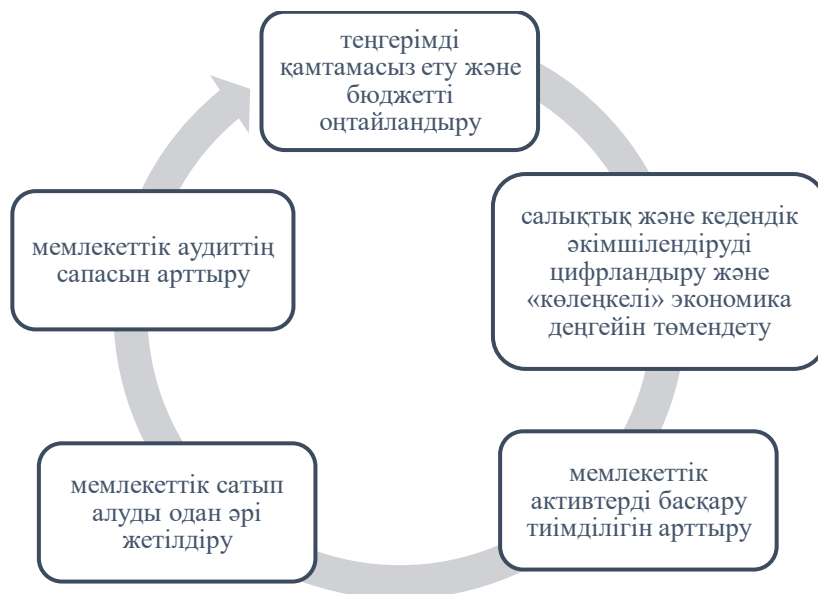
Сурет 1. Мемлекеттік сатып алуға камералдық бақылаудың 5 бағыты

Бюджетті атқарудың маңызды бөліктерінің бірі – мемлекеттік сатып алу. Бүгінгі таңда бүкіл процесі автоматтандырылғана арнайы веб-порталда жүргізіледі. Бұл жүйеге 109 мыңнан астам өнім беруші мен 24 мың тапсырыс беруші тіркелген. 2020 жылы 10,5 трлн теңгеге 1,3 млн-нан астам мемлекеттік сатып алу рәсімі камералдық бақылаумен тексерілді. Соның нәтижесі негізінде 983 млрд теңге көлемінде бұзушылықтар ескертілді. 251 млрд теңгеге қаржылық бұзушылықтар анықталған, оның ішінде 74%-ы бухгалтерлік есеп пен қаржылық есептілікті жүргізу кезінде бұзушылықтарға жатады. 1-суретте мемлекеттік сатып алуға камералдық бақылаудың 5 бағыты қарастырылған [3].