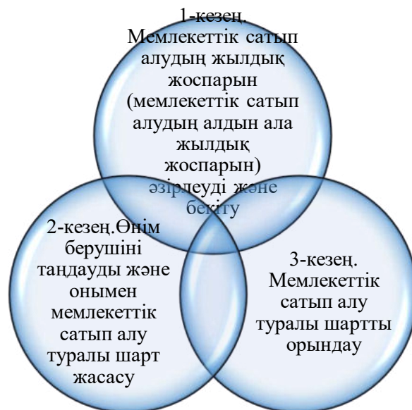
Сурет-2. Мемлекеттік сатып алу процесінің кезеңдері [7]

Бүгінгі таңда елімізде мемлекеттік сатып алудың барлық процесі автоматтандырылған. Мемлекеттік сатып алу веб-порталында 100 мыңнан астам өнім беруші және 24 мыңнан астам Тапсырыс беруші тіркелген. 2022 жылдың қорытындысы бойынша Мемлекеттік сатып алу көлемі 5,8 трлн астам теңгені құрады. Бұл ретте сатып алудың 80% - ы шағын және орта кәсіпкерлік субъектілерінен жүзеге асырылды. 2022 жылы мемлекеттік сатып алу жүйесін жетілдіру шеңберінде бәсекелестікті дамытуға, сыбайлас жемқорлық тәуекелдерін азайтуға және сатып алу процестерін жеңілдетуге бағытталған бірқатар заңнамалық шаралар қабылданды. Қазіргі уақытта Президенттің тапсырмасы бойынша министрлік жаңа "Мемлекеттік сатып алу туралы" заң әзірлеуге кірісті. Заң сатып алу рәсімдерін түбегейлі жеңілдетуге, шамадан тыс реттеуді болдырмауға, сапаның ең төменгі бағадан басымдығын белгілеуге бағытталатын болады. [8]