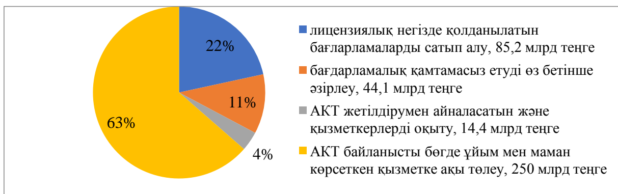
Сурет 3 – 2022 жыл бойынша АКТ-ға жұмсалған шығындар үлесі, %. Ескерту - [2] деректер негізінде автормен құрастырылған

Мемлекеттік қызметтерді толық ұсыну, мемлекеттік органдарда цифрлық жұмыстарды ұйымдастыру және оңтайландыру, персоналды оқыту үшін жыл сайын бюджеттен атаулы салаға қаржы бөлінеді. Соңғы 3 жылда мемлекеттік басқару ұйымдарын есепке алғанда ақпараттық-коммуникациялық технологияларға жұмсалған шығындар көлемі өсіп отырған: 2020 жылы – 388 млрд теңге, 2021 жылы – 443 млрд теңге, 2022 жылы – 589 млрд теңге[2].