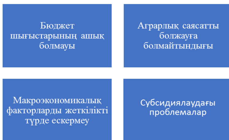
4-сурет. Бюджеттік қолдаудың тиімділігін төмендететін факторлар

Бюджеттік қолдау кезінде бірқатар факторлар оның тиімділік көрсеткіштеріне әсерін тигізеді (4-сурет).