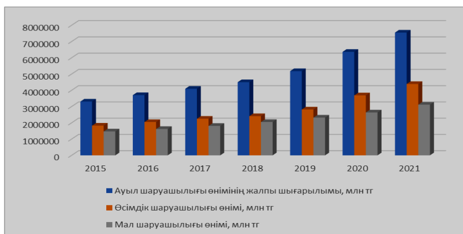
1-сурет. Ауыл шаруашылығы өнімінің даму серпіні

Қазақстанның ауыл шаруашылығы секторы соңғы жылдардағы тұрақты өсу серпініне қарамастан (1-сурет), әлі де көптеген жағымсыз факторлардың әсерінен экономиканың рентабельді емес секторларының қатарында қалып отыр [1].