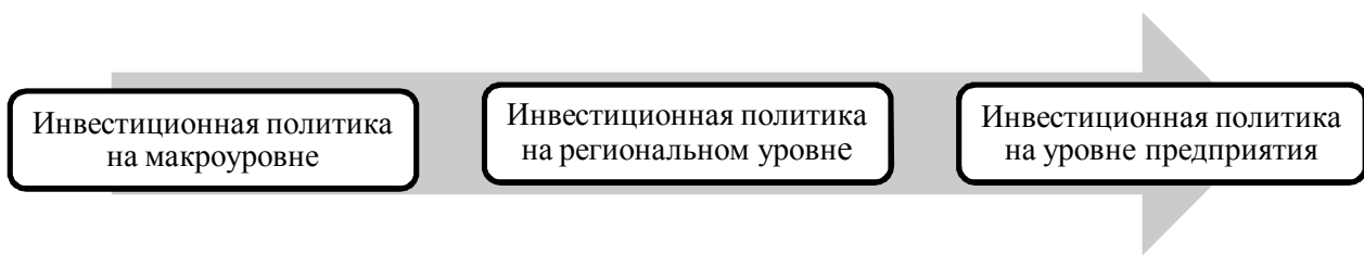
Рисунок 1 – Виды инвестиционной политики в зависимости от масштабности Примечание: составлено автором

Основной и в то же время конечной целью инвестиционной политики является положительное влияние на такие аспекты как: уровень экономики, повышение эффективности производства, а также решение некоторых социальных проблем.