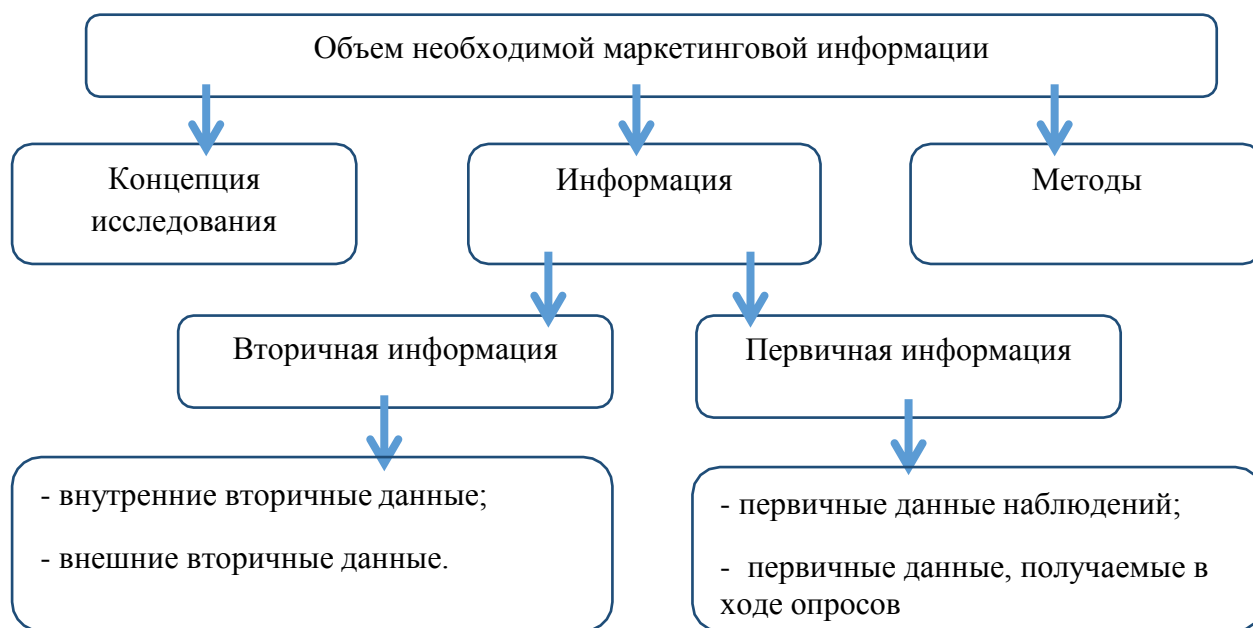
Рисунок -2. Типы маркетинговой информации

- казуальные исследования – исследования, проводимые для проверки гипотеза, касающихся причинно-следственных связей.