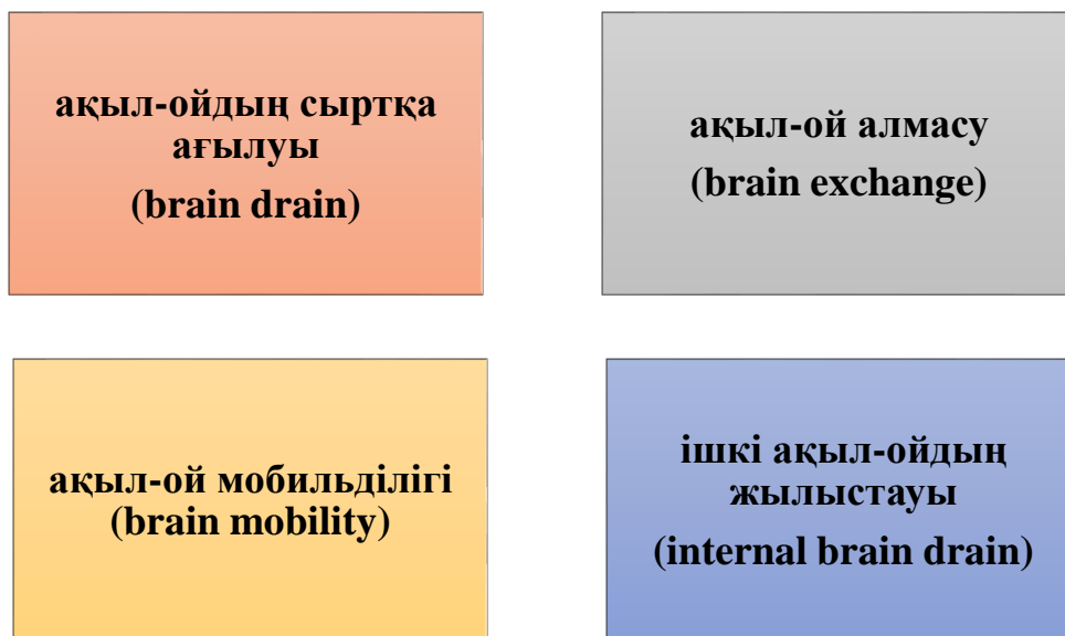
Сурет 1 Мобильділіктің ғылыми көздерде белгіленген терминдері

Кәсіби ұтқырлық бүгінгі күні жаһандық еңбек бөлінісі шеңберіндегі білімдер мен құзыреттердің таралуының үлгісі, нормасы мен мәдениеті болып табылады. И.Г. Дежина атап өткендей, «ұтқырлық - білімнің таралуының механизмі; ол зерттеулердің жаңа бағыттарын, оның ішінде пәнаралықты қамтиды және зерттеушілердің көкжиегі мен біліктілігін кеңейтуге ықпал етеді» [1]. Жиі мобильділік ғылыми көздерде мынадай терминдермен (1-сурет) белгіленетін интеллектуалды миграцияға айналады: