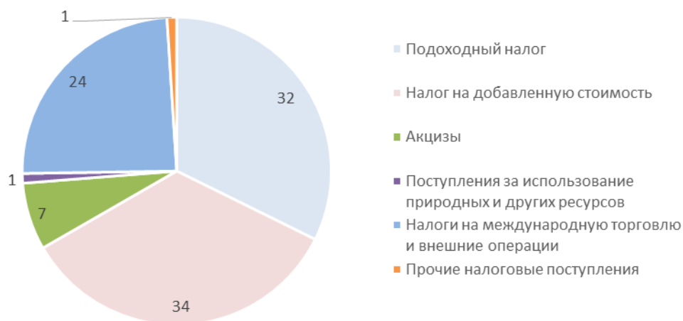
Рисунок 3- Структура налоговых поступлений республиканского бюджета за 2017 год, %

Доля налогов на международную торговлю и внешние операции в структуре налоговых поступлений выросла до 25% (в 2017 году – 22%).