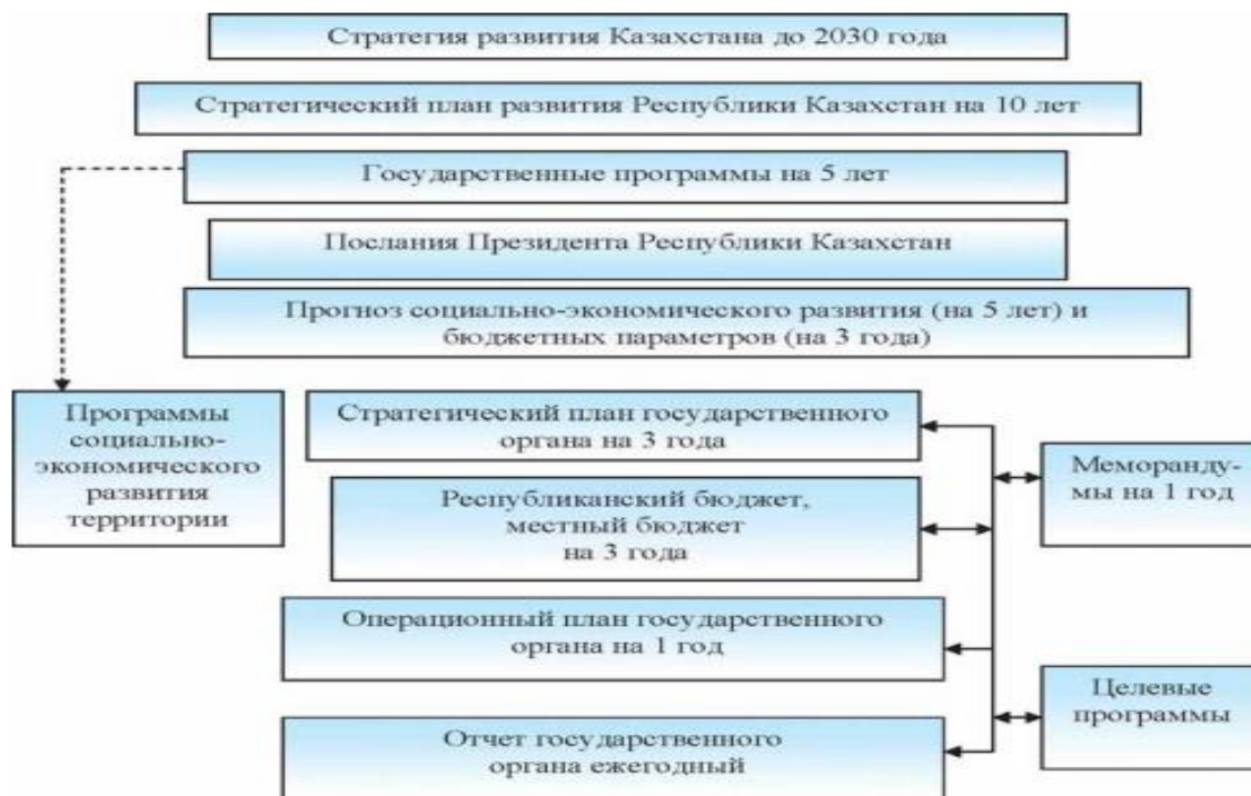
Рисунок 1 – Система государственного планирования Республики Казахстан

Система государственного планирования включает следующие взаимосвязанные уровни: