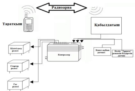
Сурет 1 – Құрылғының құрылымдық сұлбасы