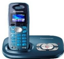
Сурет 1 – Радиотелефон Panasonic KX-TG80

Жүйе жұмысында территорияны радиусы 0,5-10км соттарға бөлуге болады.