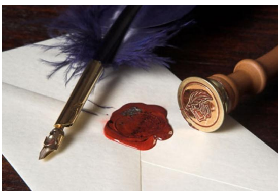
Сурет 2 - Деректердің құпиялылығы.

Егер мөр бұзылмаған болса, ақпараттың тұтастығы сақталды дегенді білдіреді. Сондай-ақ, конвертке басылған мөр хаттың шынайы екендігінің дәлелі болды.