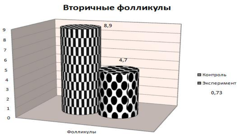
Рисунок 2. Вторичные фолликулы