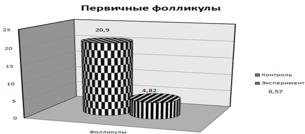
Рисунок 1. Первичные фолликулы

Полученные нами сведения указывают на то, что высокочастотные волны оказывают детримальное воздействие на фолликулогенезные процессы животного при однократном облучении экспериментальных животных.