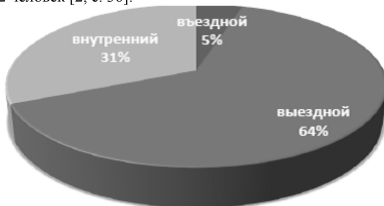
Рисунок 1 - Структура обслуженных посетителей туристическими фирмами в 2016 году

В 2016 году в Казахстане зарегистрировано 2 352 туристических фирм, по форме собственности всего 3 государственные, а остальные частные. Туристическими компаниями обслужено 945 302 человек [2, с. 36].