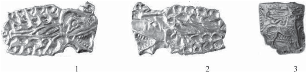
Рис. 3. Полурыба-полуолень как перевоплощённый Эгипан (рогатая рыба в скифском зверином стиле). 1 – золотой нащёчник – обкладка деревянной основы, Гайманова могила, центральная гробница № 2, конская могила, конь 2 (по: Канторович, 2015, с. 1660, рис. 1а); 2 – золотой нащёчник – обкладка деревянной основы, Гайманова могила, центральная гробница № 2, конская могила, конь 2 (по: Канторович, 2015, с. 1660, рис. 1а); 3 – золотая обивка деревянной чаши, находка у с. Калинино, курган 3, погребение 3 (по: Канторович, 2015, с. 1455, рис. 1а).

Fig. 3. Half-fish – half-deer as a reincarnated Aegipanos (horned fish in the Scythian animal style). 1 – golden cheek pad – facing of a wooden base, Gaimanov's grave, central tomb No. 2, horse grave, horse 2 (after Kantorovich, 2015, p. 1660, fig. 1a); 2 – golden cheek pad – facing of a wooden base, Gaimanov's grave, central tomb No. 2, horse grave, horse 2 (after Kantorovich, 2015, p. 1660, fig. 1a); 3 – gold upholstered wooden bowl, Finding near the village of Kalinino, barrow 3, burial 3 (after Kantorovich, 2015, p. 1455, fig. 1a).