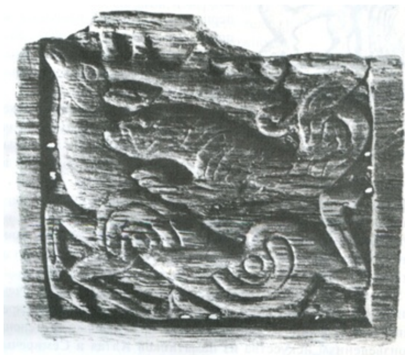
Рис. Плагетка с изображением сцены терзания кошачьим хищником оленя

Кездесетін ағаш тілімшелердің барлығы (пластинки) балқарағай ағашынан көркемдеп ою арқылы жасалған. Көшпелілер өнерінде ойып жасау әдісімен жасалған заттарға – пышақты негізгі құрал ретінде пайдаланды. Барлық заттардың беткі жағы – пышақтың жүзімен рельеф және барельеф әдісімен ойылған. Ал, төменгі жағы – пышақ немесе шоттың жүзімен бірінші ретті өңдеуден өткен тегіс болып келеді. [4, 217-б]. Ежелгі Берелдіктердің өнерін зерттеу кезінде негізгі композициялық образдардың бірі – шабуыл сәті (сцены терзания). Көп кездесетін образдардың біріне тоқтала қарастырайық.