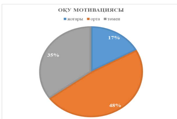
Сурет 1. «Оқушылардың оқу мотивациясы» сауалнамасы бойынша нәтижелердің пайыздық көрсеткіші.

Эксперименттің бірінші сатысының нәтижелері. «Оқушылардың оқу мотивациясы» сауалнамасы бойынша респонденттердің 16-сы 0-7 ұпай жинап, оқу мотивациясының төмен екендігін көрсетсе, 22-сі 8-15 ұпай жинап орта деңгейді көрсетті, ал 8 респондентте оқу мотивациясы жоғары деңгейде екенін көреміз (1-сурет)