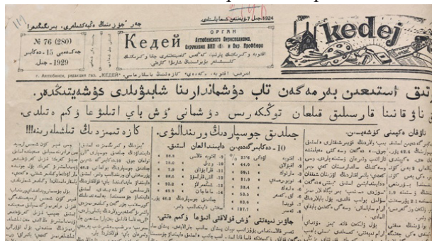
1-сурет – «Кедей» газетінің 1-беті.

1-суретте «Кедей» газетінің 1929 жылғы 76-санының 1-ші беті беріліп отыр.