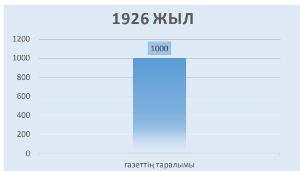
1-сызба. «Кедей» газетінің 1926 жылғы соңғы санының таралым көрсеткіші.

«Кедей» газетінің 1928 жылдағы алғашқы саны 2600, 13-нөмірі 2620, 19-нөмірі 2700, 30-нөмірінен бастап редакторлық қызметтен босатылғанға дейін 3000 данамен таралған. (1-ші, 2-ші және 3-ші сызбадан қараңыз).