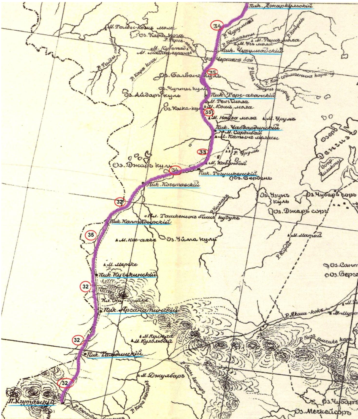
Рис. 2. Реконструкция пикетного маршрута от пикета Джаркульского до пикета Улутау на «Карте юга Акмолинской области 1891 года» (по: Шмидт, 1894: 163)

дороги находим на страницах журнала «Записки Западно-Сибирского отдела Императорского Русского географического общества»: «Из Акмолинска колесная дорога направлялась луговыми степями к реке Нура и по ее берегу; потом она шла к озеру Балыктыбайтор на верховья реки Кулан-Утмеса и к невысокому горному кряжу, за которым раскидывались то луговые, то солонцовые степи. В этой местности путь пересекал реку Сары-су и по её притоку Монака достигал Ақтау. На всем его протяжении, заключавшем 325 верст, между Акмолинском и Актавским укреплением поставлено было 8 пикетов. От Актасара путь тоже шел луговыми степями за реку Ишим к озеру Джаркуль и реку Чурумсай, а оттуда к реке Терс-Аккан и берегом последней. Далее за озером Арганын-куль начинались горы, дорога пересекала верховья реки Кара-Тургай и достигла до Улутау. Все расстояние простиралось на 385 верст. На нем поставлено было 11 пикетов и нигде не встречалось препятствий для колесной езды» (Балкашин, 1880: 8).