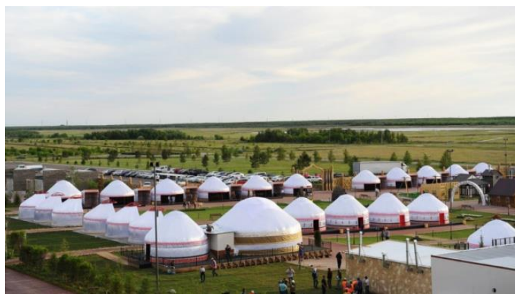
Рис.1. Национально-культурный комплекс «Этноаул», EXPO-2017, г. Астана. Фото общего вида.

Этноаул - это реальная возможность для туристов совершить путешествие в прошлое и прочувствовать атмосферу давно минувших столетий, изучить национальную культуру и традиции. Одним из показательных примеров формирования современного «Этноаула» является Национально-культурный комплекс, построенный на территории EXPO-2017, который стал уникальным культурно-туристическим и имиджевым проектом этого всемирного мероприятия. Комплекс знакомит посетителей с богатой историей, культурой, искусством и традициями казахского народа, где любой желающий может перенестись в этнокультурную среду кочевой цивилизации и полностью насладиться повседневной и праздничной жизнью аула (рис. 1).