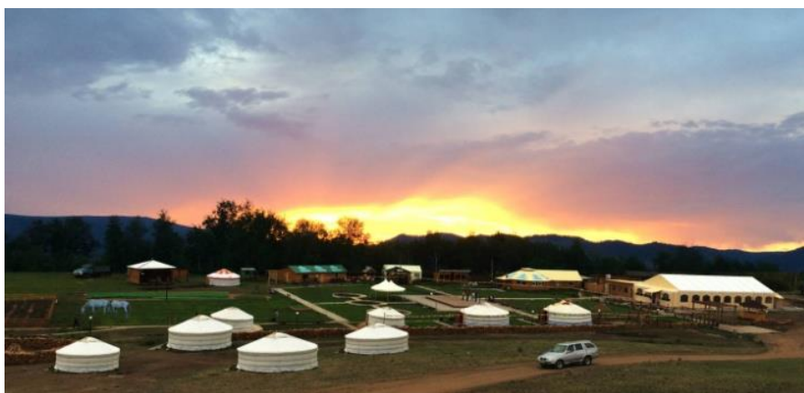
Рис. 4. Этнокомплекс «Степной кочевник, Ацагат».г. Улан-Удэ, Россия. Фото общего вида.

Туристический этнокомплекс «Степной кочевник» расположен в России в живописном месте Ацагатской долины у подножия священной горы Тамхита, на вершине которой жители села Ацагат совершают обряд почитания хозяев местности — «Обоо» (рис.4).