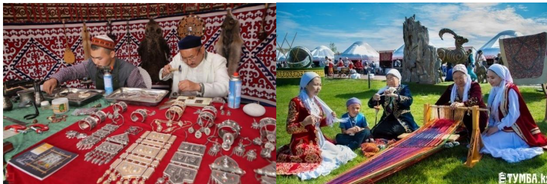
Рис.3. Виды искусства казахских мастеров.

на сам процесс изготовления. Главная цель – продемонстрировать культурное разнообразие изготавливаемых образцов – познакомить гостей с различными изделиями в национальном стиле. Основные демонстрационные образцы коллекций были представлены в стационарных экспозиционных комплексах и позволяли продемонстрировать творчество и мастерство современных молодых художников в различных жанрах – живопись, графика, скульптура, ювелирные украшения, резьба по дереву и кости, керамика, роспись, вышивка, войлок (рис. 3).