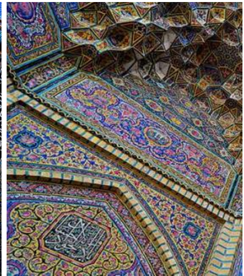
Рисунок 8 - Каллиграфия в мечети Насир аль-Мульк, Шираз, Иран.

Орнамент с самого начала играл большую роль во всех видах исламского искусства, включая архитектуру, и сохранял своё значение на всех этапах его развития. Именно характер узоров, которые украшают любой памятник, будь то стена здания или страница книги, является тем, что определяет данный памятник как творение мусульманского художника. В конечном счёте, орнамент занял главенствующее положение в системе искусств ислама и стал тем творческим пространством, в котором художник мог осуществлять свои замыслы.