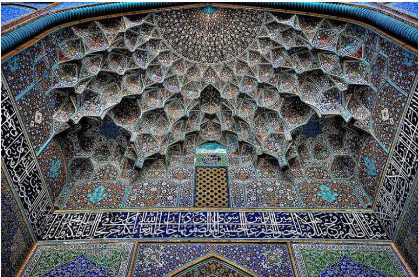
Рисунок 7 - Каллиграфия в мечети Шейха Лютфуллы, Исфахан, Иран.