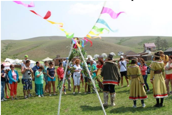
Таблица 3. Виды национальных развлечений г.Улан-Удэ, Россия.

поиграть в национальные игры, пожить в настоящих войлочных юртах, научиться мастерству национальной кулинарии, окунуться в деревенский быт, поухаживать за лошадьми, верблюдами и другими домашними животными. Предусмотрена организация познавательных экскурсий, пешие и конные прогулки на гору Тамхита и в Агатский дацан, который находится рядом с комплексом. Он знаменит известными во всем мире учеными ламами конца XIX — начала XX веков (таблица.3).