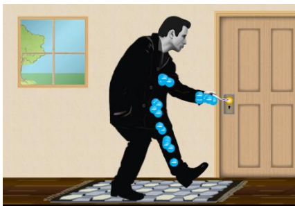
1- сурет. Адамның аяғының кілеммен әрекеттесуі

(2-сурет)Бірақ,неге олай болды деген сұрақтың жауабына мән берілмейді.Ал,оқулықтағы анықтаманың мәнін ұғыну қиын,қанша оқысақ та теориясы түсініксіз,жаттап алуға тура келеді.