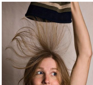
2 -сурет. Адамның шашының бас киіммен әрекеттесуі