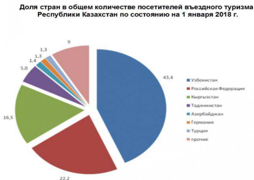
Рисунок 1. Доля стран в общем количестве посетителей въездного туризма РК на 2018 г.

Если говорить об объеме рынка туризма в Республике Казахстан, то одним из основных параметров статистики туризма, обеспечивающим учет стоимостных характеристик индустрии туризма, являются расходы, которые включают две основные составляющие: внутренние расходы на туристское потребление и международные туристские расходы. В данных, публикуемых WTTC, в качестве первого показателя выступает категория «Внутренние туристские расходы» (Domestic Travel and Tourism Spending).