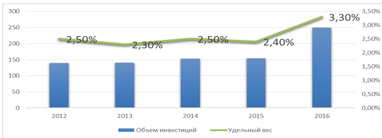
Рисунок –1 Инвестиции в основной капитал сельского хозяйства Республики Казахстан за 2012-2016 год, млрд.долл.

Источник: Официальный сайт Комитета по статистике Министерства Национальной экономики Республики Казахстан [7]