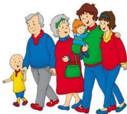
№1 сурет. Қыдыру (gezmeK) етістігімен байланысты

Отбасымызбен қыдырып жүрміз. (Ailece geziyoruz).