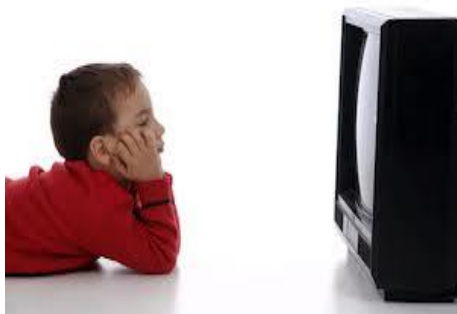
№2 сурет. Көру (seyretmek) етістігімен байланысты

Бала телевизор көріп отыр. (çocuk televizyon seyrediyor)