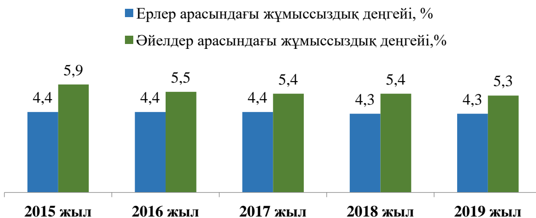
Сурет 2. Қазақстан Республикасындағы ерлер мен әйелдер арасындағы жұмыссыздық деңгейі, 2015-2019 ж.

Ескерту: [2] мәліметтері негізінде автормен құрастырылды