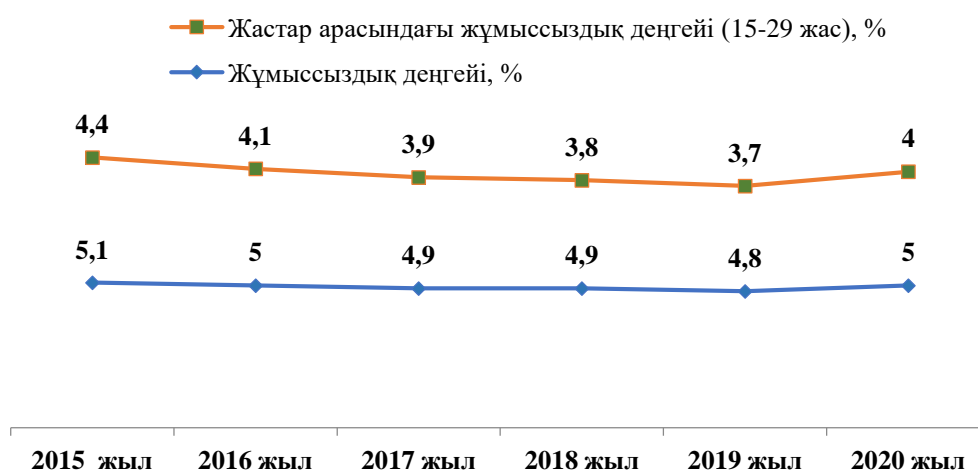
Сурет 3. Қазақстан Республикасындағы жастар арасындағы жұмыссыздық деңгейі, 2015-2020 ж.

Халықаралық интеграцияның және бәсекелестіктің күшеюі еліміздегі жастар арасындағы жұмыссыздық мәселесіне ерекше назарды аударуды талап етеді. Жастардың әртүрлі салаларда жетерліктей біліктілігі мен тәжірибесі болмаса да, инновациялық және шығармашылық әлеуеті жоғары әлеуметтік-экономикалық белсенді топ. Сондықтан жастарды жұмыс нарығында жұмыспен қамтамасыз ету әрі олардың белсенділігін, бәсекеге қабілеттілігін жоғары деңгейде ұстап отыру маңызды. Төмендегі суретте жалпы жұмыссыздық деңгейінен жастар арасындағы жұмыссыздық деңгейі оң көрсеткішке ие екендігін байқауға болады. 2015 жылы жастар арасындағы жұмыссыздық көрсеткіші 4,4% болса, 2016-2019 жылдар аралығында сәйкесінше, 4,1%-дан 3,7%-ға дейін төмендеген. 2020 жылы бұл көрсеткіш 0,3%-ға көтерілгенін, яғни 4%-ды құрағанын көріп отырмыз.