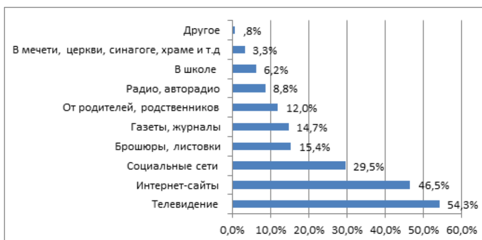
Рисунок 1 – Распределение ответов на вопрос: «Из каких источников информации Вы узнали о нетрадиционных религиозных течениях и организациях?», (в %)

Мы видим, что при сохранении важного значения телевидения как источника получения информации, среди молодежи все большее распространение получает интернет. По-видимому, увлечение молодежи интернетом можно объяснить, прежде всего, доступностью данного источника информации, возможностью самостоятельно выбирать интересующую тематику и в целом тем фактом, что это модно. Помимо приведенной тройки лидеров источников информации о НРД среди молодежи, далее по убывающей идут такие как: брошюры, листовки (15,4%), газеты, журналы (14,7%), родители, родственники (12%), радио (8,8%), преподаватели, одноклассники (6,2%) (Рисунок 1).