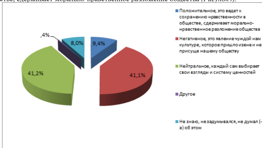
Рисунок 4 – Распределение ответов на вопрос: «Ваше отношение к ношению закрытой женской одежды (хиджаб, никаб, паранджа)?», (в%)

Третья переменная, при помощи которой измерялось отношение молодежи Казахстана к НРД, заключалась в выявлении отношения к внешним проявлениям нетрадиционной религиозности, в частности, к ношению хиджаба. На вопрос анкеты «Ваше отношение к ношению закрытой женской одежды (хиджаб, никаб, паранджа)?» было предложено три варианта ответа: положительное, нейтральное и негативное. Итоги опроса показали, что мнения молодежи практически поровну разделились между нейтральной и негативной оценкой (41,1% и 41,2% соответственно). Это может указывать на то, что, действительно, в обществе еще не сложилось устойчивой общепринятой оценки данного феномена, и молодежь, находясь между религиозными и секулярными ценностями, колеблется между тем, что хиджаб - это нормально, и тем, что это плохо. 9,4% опрошенной молодежи отметили позитивную роль хиджаба, ответив, что он ведет к сохранению нравственности в обществе, сдерживает морально-нравственное разложение общества (Рисунок4).