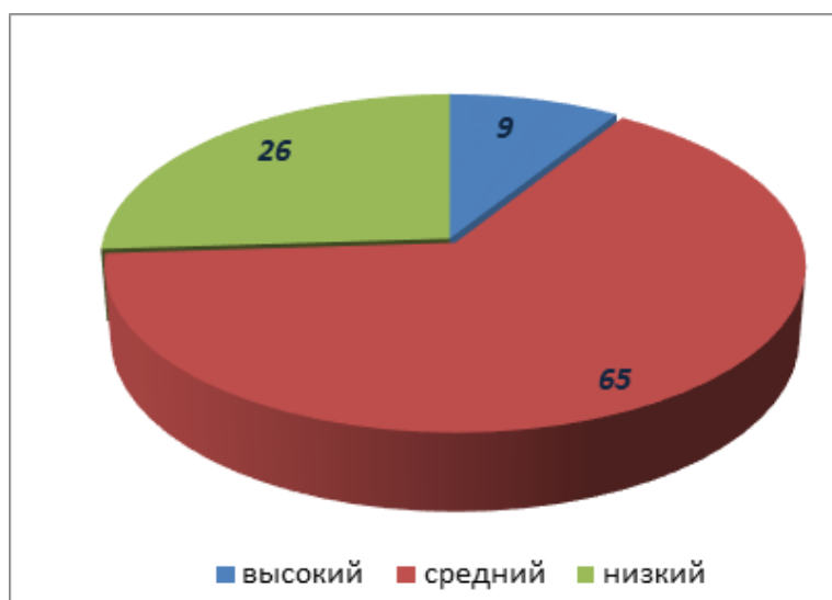
Рисунок 1 – Уровни к профессиональному саморазвитию у студентов СаpНИГУ

Выявить и показать представление у современной молодежи о процессе саморазвития и способах его осуществления в период профессиональной подготовки попытались сделать сотрудники Горно-Алтайского государственного университета. В результате опроса было установлено, что 32 % опрошенных понимали саморазвитие как самосовершенствование, 28 % понимали как получение новых знаний и 22 % понимали как развитие в себе положительных качеств личности [11]. Анализ полученных ответов позволило сделать вывод, что саморазвитие – это активный процесс, который требует приложения усилий, четкого осознания того, что необходимо в себе развить.