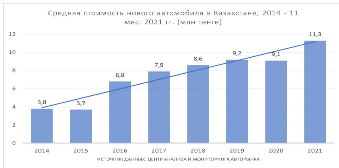
1-диаграмма: Қазақстандағы автокөліктің орташа бағасы

- жаңа автомобильдерге бағаның өсуі және пайдаланылған автомобильдерді әкелуді шектеу есебінен шетелдік есепте 210 мыңнан астам машина пайда болды. Осы 210 мың автомобильдің жасы 3 жастан асқан делік, демек, олардың Қазақстан аумағында бастапқы тіркелуі үшін әрқайсысынан 1,5 млн теңгеден астам төлеу қажет. Егер бір автомобильді алғашқы тіркеу мөлшері ең болмағанда 50 мың теңгеге дейін азайтылса, онда 210 мың көлікті тіркеуден түскен ақша қаражатының жалпы сомасы 10,5 млрд теңгені құрайды. Яғни, мемлекеттік бюджет мұндай соманы табуы мүмкін;[4]