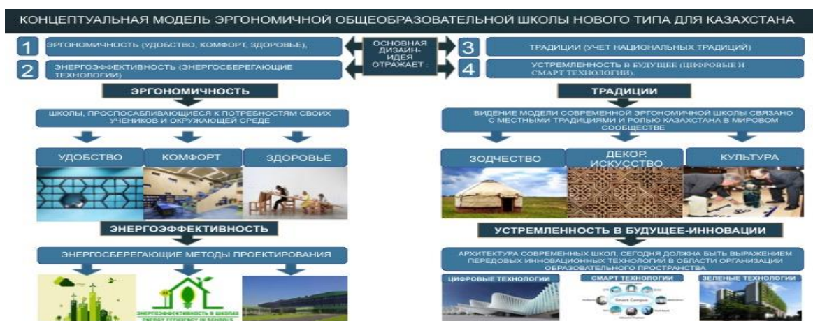
Рисунок 2-модель проекта «Доступность и эффективность образовательного пространства»