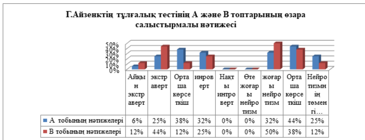
Сурет 3. Г.Айзенктің тұлғалық тестінің А және В топтарының өзара салыстырмалы нәтижесі

Г. Айзенктің тұлғалық тесті мен А.Г. Маклаков және С.И. Чермяниннің Көпдеңгейлі тұлғалық сұрақнамасы арқылы біз Қарулы Күштер қатарындағы әскери салада еңбек ететін әйелдердің кәсіби маман ретінде қарастыру барысында, олардың бойындағы тұлғалық-психологиялық ерекшеліктерін қарастырдық (Сурет 3).