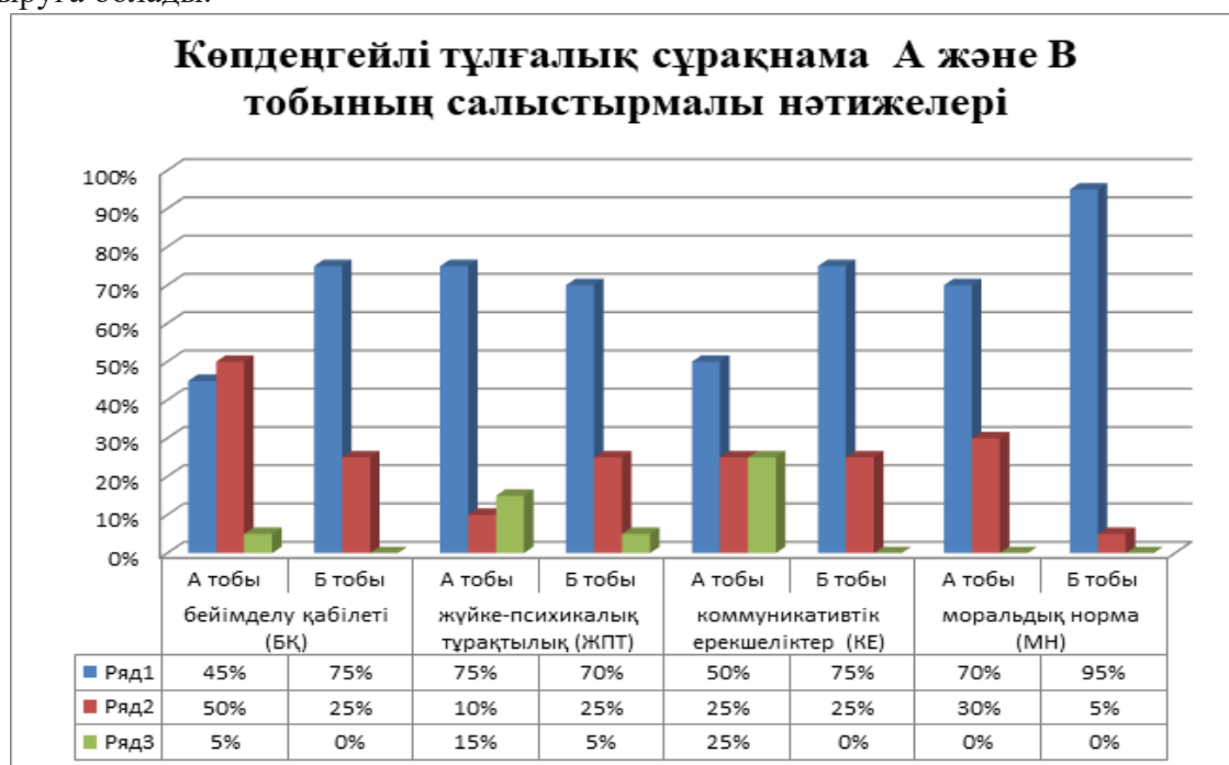
Сурет 4. А және В топтарының нәтижесінің салыстырмалы % көрсеткіші

Екі топтың өзара нәтижесінің салыстырмалы % көрсеткішін төмендегі Сурет 4-тен қарастыруға болады.