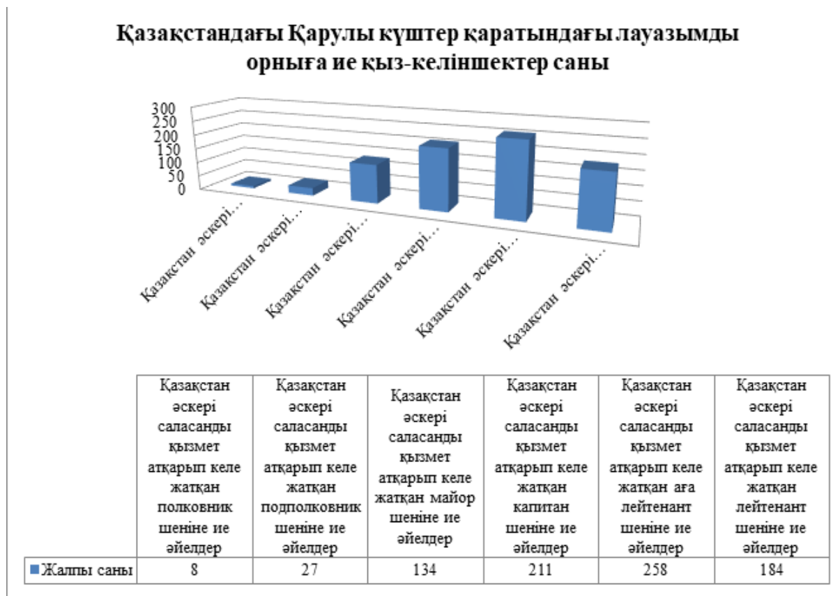
Сурет 1. Қазақстандағы Қарулы күштер қатарындағы лауазымды орынға ие қыз-келіншектер саны

Қазақстан Республикасында Қарулы күштер қатарында қызмет ететін қыз-келіншектер Қорғаныс министрлігінде, Құрлық әскерлері, Әуе қорғаныс күштері, Әскери-теңіз күштері, Денсаулық-шабуылдау әскерлері, теңіз жаяу әскерлері, бітімгершілік күштердің, арнайы мақсаттағы бөлімшелердің офицерлері, әскери полиция және аумақтық қорғаныс бригадасы қатарында еңбек етуде. Қазақстан Республикасы аумағында Қарулы күштер қаратында қызмет ететін қыз-келіншектер саны 822 құрайды. Қазақстандағы Қарулы күштер қаратындағы лауазымды орынға ие қыз-келіншектер санын 1-суреттен қарастыруға болады.