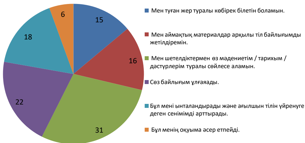
Бiлiм алушылардың аймақтық мәдени материалдарға қатысы