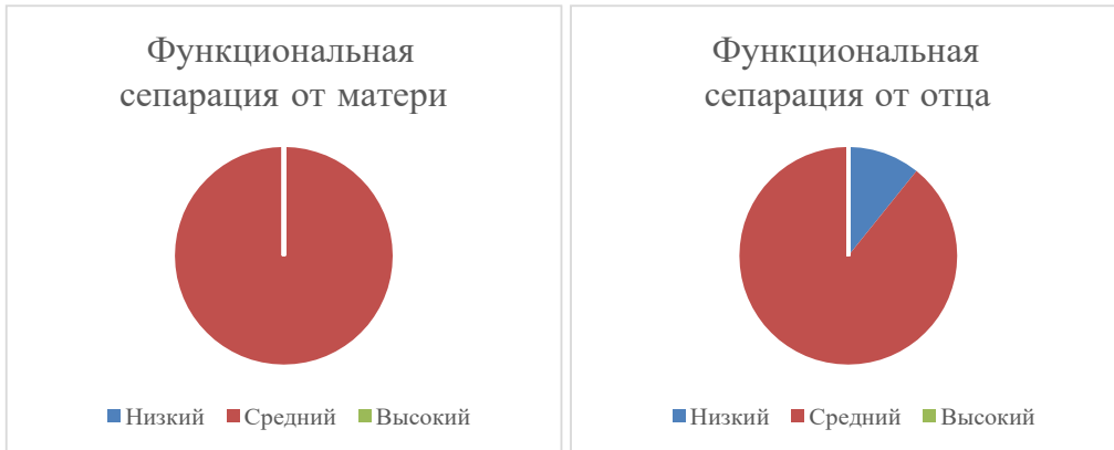
Рисунок 4. Данные по шкале функциональной сепарации