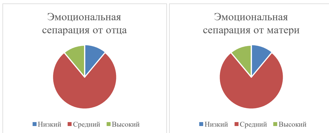
Рисунок 2. Данные по шкале эмоциональной сепарации

ставлены на рисунке 4, они имеют усредненные показатели, не были выявлены ни высокие, ни низкие уровни. Однако по этой же шкале от отца был определен низкий уровень у 11%, средний уровень у 91%, не удалось выявить высокий уровень ни у одного респондента.