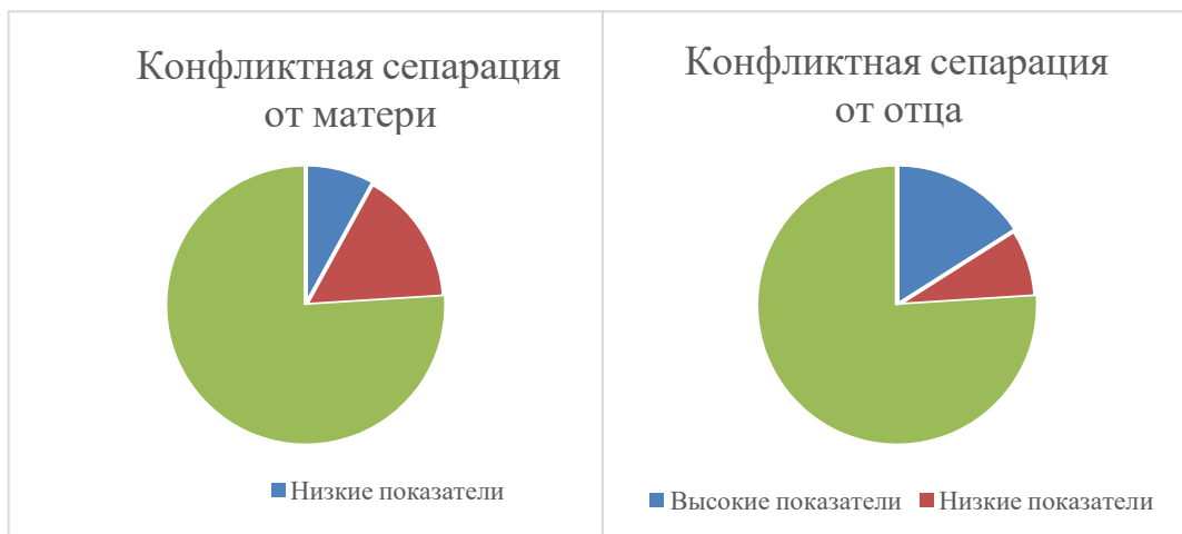
Рисунок 1. Данные по шкале конфликтной сепарации

По шкале функциональной сепарации от матери результаты всех опрошенных пред-