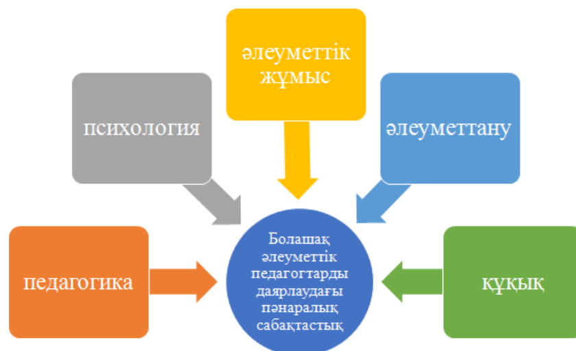
Сурет 1. Болашақ әлеуметтік педагогтарды кәсіби іс-әрекетке даярлаудағы пәнаралық сабақтастық

ген Н.В.Кузьмин, әлеуметтік-педагогикалық әрекетке деген даярлық мәселесін В.Ш.Масленикова, кәсіби іс-әрекетке даярлықты мұғалімнің меңгеруіне тиесіл жалпы педагогикалық біліктер жиынтығы ретінде В.А.Сластенин қарастырған жөн деген пікірді айтады [20].