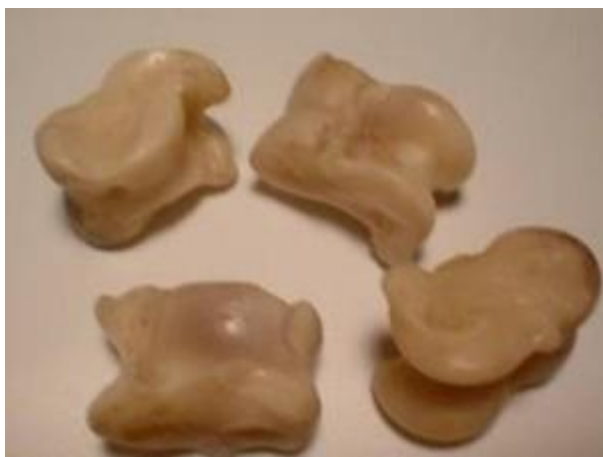
Асық, Сурет №1

Асықтың физиологиялық ерекшелігіне байланысты аталуы: