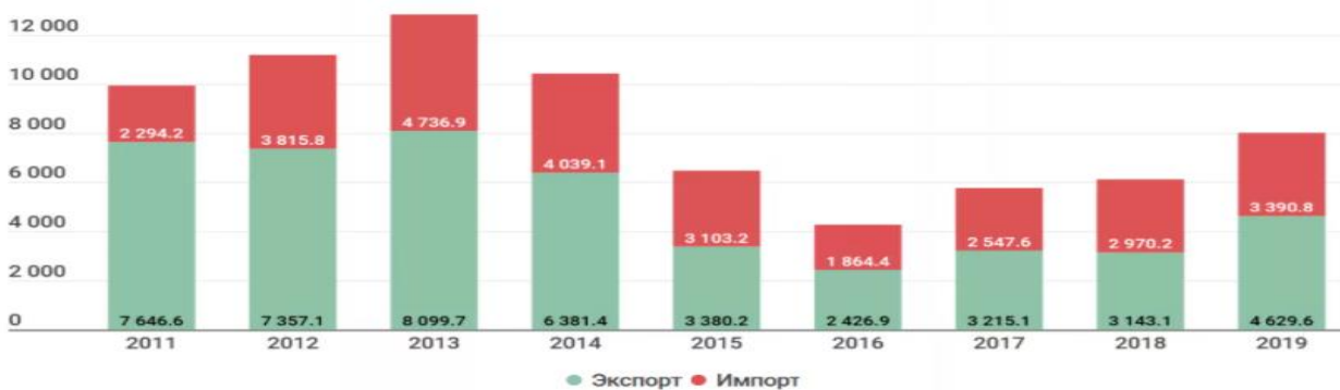
Сурет-1. Қазақстан мен Қытай арасындағы сауда айналымы (млн. долл) [2].

Қазақстан Республикасы мен ҚХР арасындағы сауда-экономикалық ынтымақтастықтың мұнай-газ саласы ең серпінді қарқынмен дамуда. Қытайлық компаниялардың Қазақстанның мұнай-газ секторына белсенді қатысуы 1997 жылы Қытай ұлттық мұнай-газ корпорациясының (CNPC) қазақстандық «Ақтөбемұнайгаз» компаниясының 60% акциясын сатып алуынан басталды. Сонымен қатар, сол жылы аталған компания Өзен мұнай кен орнын игеру және пайдалану құқығын алды, одан екі елдің энергетикалық ынтымақтастығы басталды. Қазіргі уақытта Қытай ұлттық мұнай корпорациясы 89,17% акцияға ие. 10 жыл ішінде Қазақстан Қытайға шамамен 53,72 млрд АҚШ доллары көлемінде мұнай мен мұнай өнімдерін, сондай-ақ газ экспорттады. Физикалық көрсеткіштер бойынша бұл шамамен 87,3 миллион тонна және 1,56 миллиард текше метр газды құрайды [3].